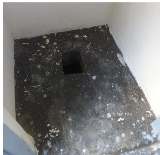
... ganz ohne Sanitärkeramik – einfach, aber funktionell